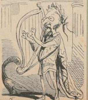
Offenbach als Orpheus