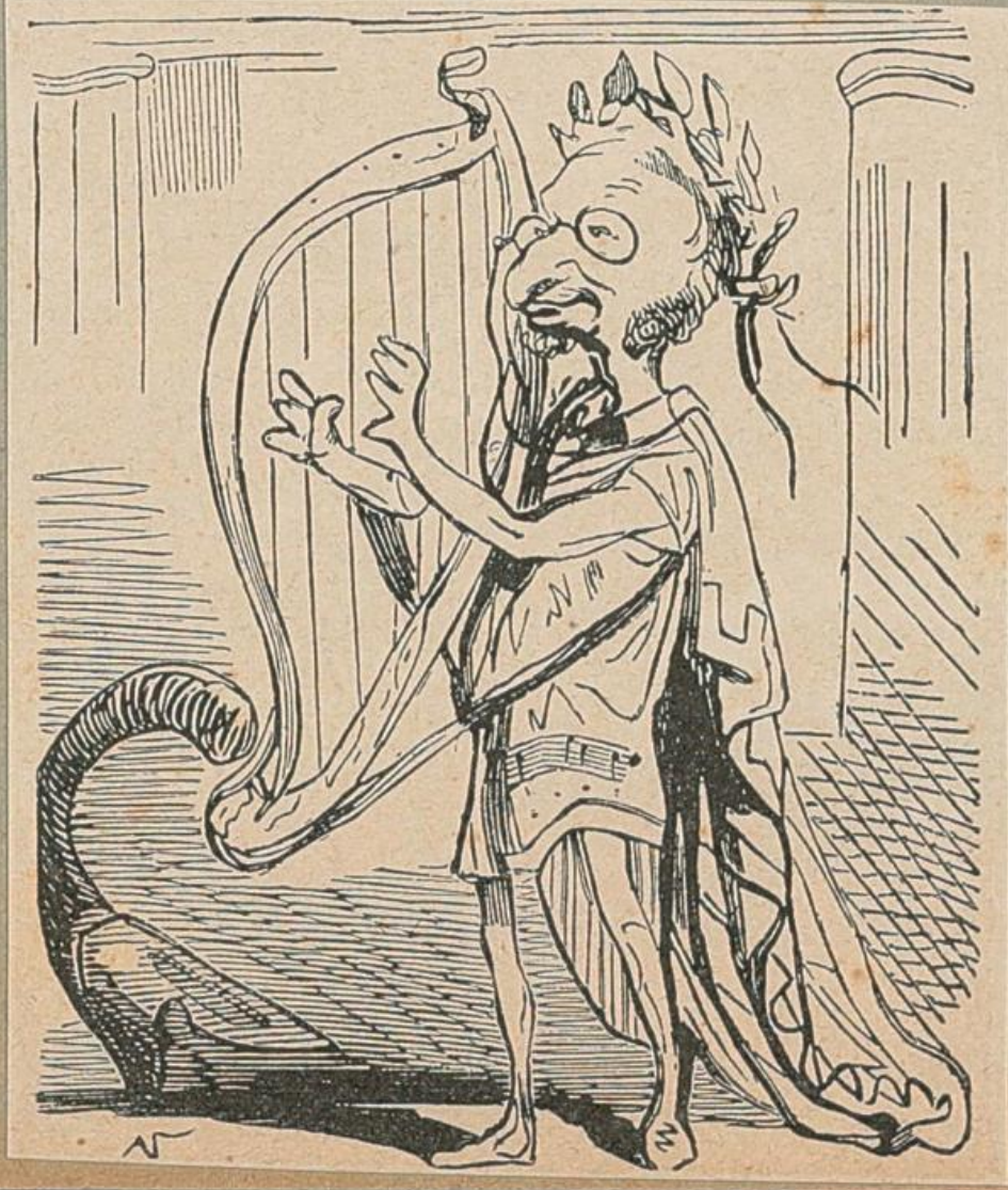
Offenbach als Orpheus