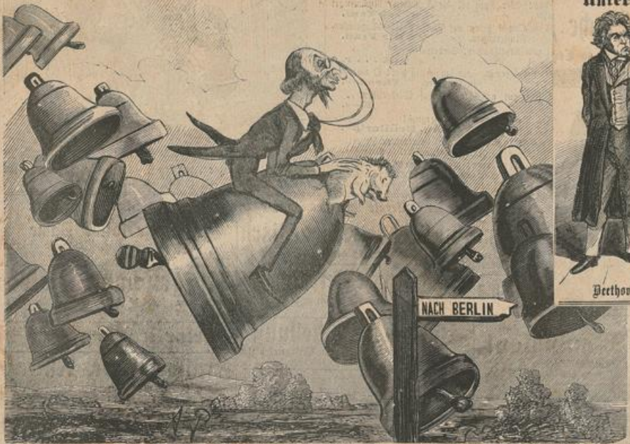
Während die geweihten Glocken nach Rom ziehen, eilt die Ungeweihte „Selena-Glocke“ nach Berlin.