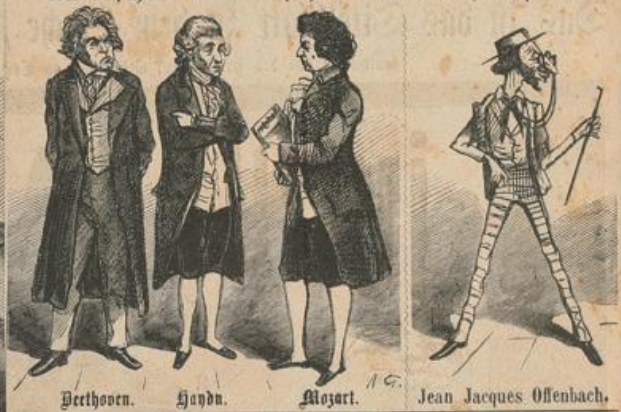
Beethoven. Haydn. Mozart. Jean Jacques Offenbach.