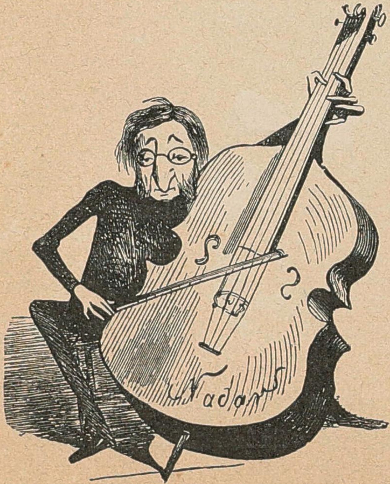
6. Offenbach. Gez. v. Nadar