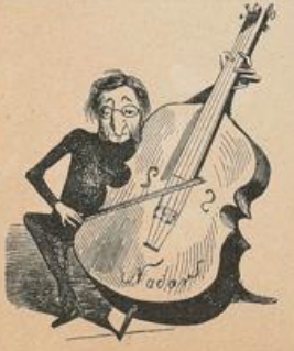
Offenbach. Gez. v. Nadar.

Offenbach. Ich höre, daß Sie — ein so verdienstvoller Mann — jetzt dem Mangel Preis gegeben sind? So weit mußte es also kommen, daß ein Schriftsteller, der den Wienern hunderte von vergnügten Abenden bereitet hat, jetzt an die Milde des Publikums appelliren muß?! Sehen Sie, das thut mich nicht. Warum waren Sie aber auch immer so furchtbar toll! Ich trete Ihnen eine meiner Aulen ab und Sie werden leben. Sie machen noch Ihr Glück!