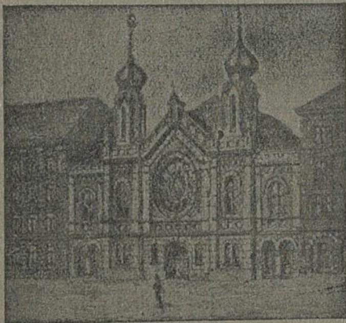
Briggtenauer Israelitische Tempelverein Wien, XX., Kluckygasse 11

Druck : Leon Griffel, Wien, XX. Klosterneuburgerstraße 2