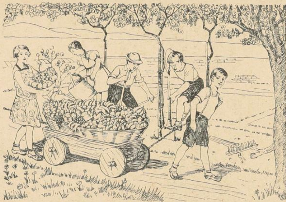
DEN KINDERN ZUR CHAMISCHO-OSSOR-FEIER vom Vorstande der Israelitischen Kultusgemeinde Wien.