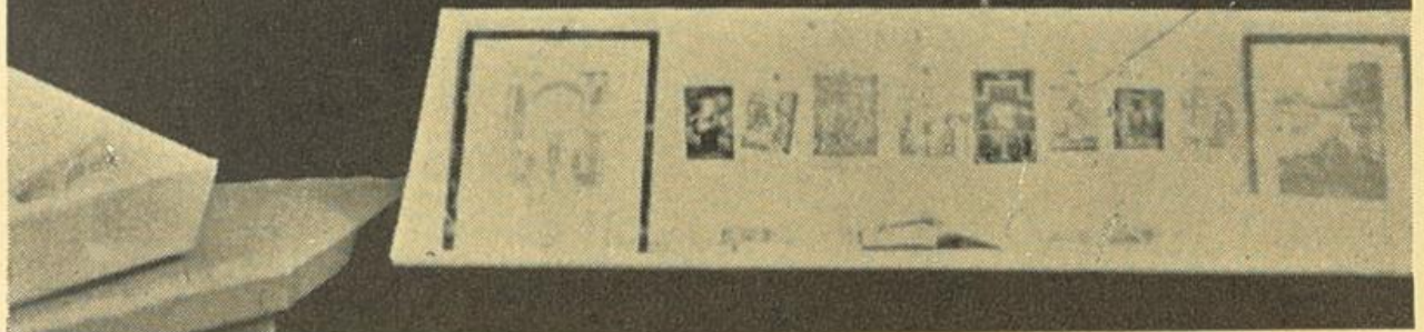
Darstellung des jüdischen Religionsunterrichtes in der Ausstellung „Unsere Schule“