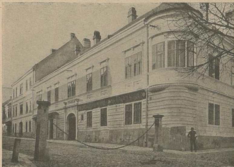
Simson Wertheimersches Haus.